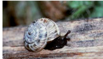
Zwerg-Heideschnecke ( Xerocrassa geyeri )